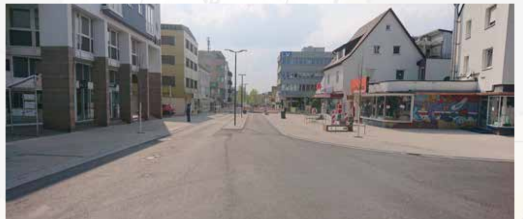
Zum Abschluss wird Stück für Stück ein strapazierfähiger Deckbelag aufgetragen.

Auch wenn der bereits fertig gestellte Teil der Hindenburgstraße optisch schon richtig was hermacht, ist die momentane schwarze Straßenfläche aber noch nicht der Deckbelag. Sozusagen als letzter Akt wird ein Belag in einer Stärke von zwei Zentimetern aufgetragen. Dieser so genannte Buspflaster wird farblich den Pflasterbelägen in den Gehwegen angeglichen und hat gegenüber dem Asphalt den Vorteil, haltbarer zu sein – sowohl was Temperaturen als auch Belastungen angeht. In der Folge bleiben die üblichen Spurrillen aus, die sich bei Schwerlast beispielsweise an Bushaltestellen gerne bilden. Zudem wird der