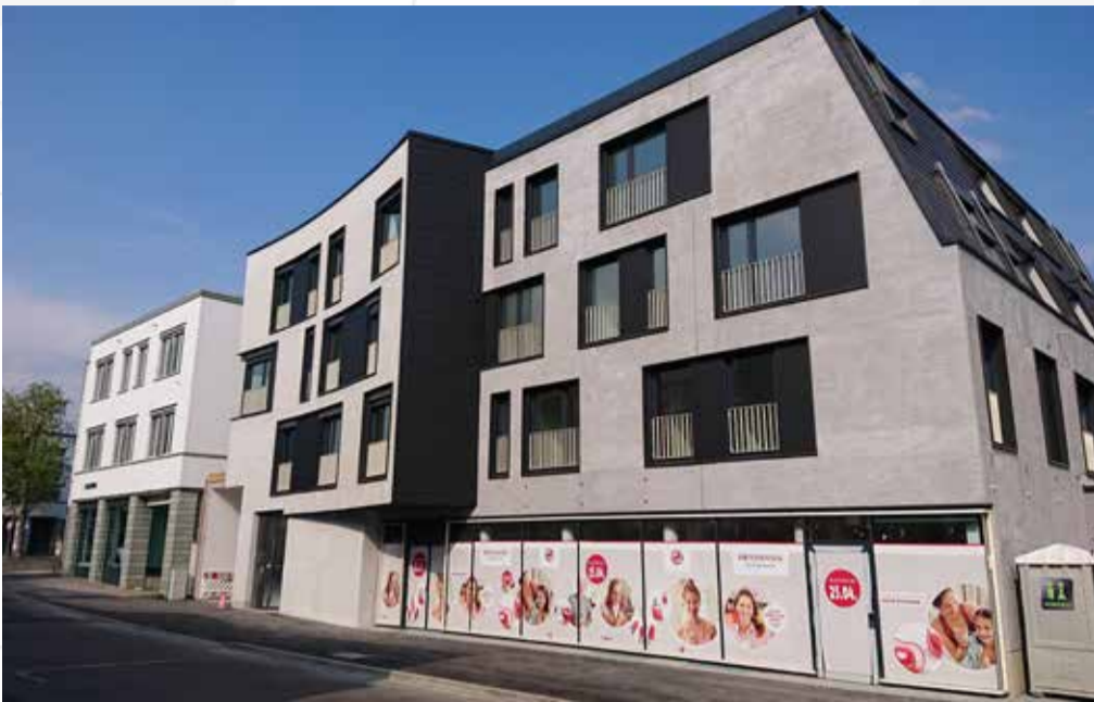
Im Erdgeschoss der Drogeriemarkt, darüber die Pflege-WG.

Mit der Neubebauung des Grundstücks Esslinger Straße 18 konnten zwei für Nellingen wichtige Anliegen unter einem Dach vereint werden: Die Ansiedlung eines Drogeriemarkts und eine bürgerschaftlich getragene, ambulant betreute Wohngemeinschaft für ältere Menschen mit Pflegebedarf.