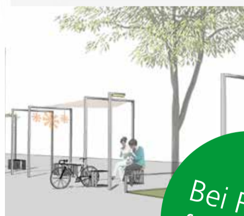
Die Möblierung entlang der Hindenburgstraße wird noch vervollständigt.

Die Fahrradbügel entsprechen in der Größe dem Möblierungskonzept, das für die Hindenburgstraße entwickelt wurde und sind so lang wie ein Erwachsenenfahrrad. Der Standort wurde mit dem Rewe-Markt abgestimmt. Kunden mit Fahrrad haben so einen komfortablen und direkten Zugang zum Markt. Gleichzeitig bilden die Bügel eine Barriere zur Straße, damit Personen beim Verlassen des Einkaufsmarkts geschützt sind. Fahrradfahrer sollten aber darauf achten, dass ihre Räder nicht unnötig über die Fahrradbügel hinaus in den Gehweg ragen.