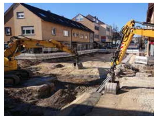
Zügiger Fortschritt trotz Corona.

Die Bauarbeiten wurden hingegen durch die Corona-Krise nicht ausgebremst und konnten in den vergangenen Wochen wie geplant weiter geführt werden. Dabei hat der Kreuzungsbereich Otto-Schuster-Straße einige Überraschungen und Herausforderungen bereit gehalten. Eine Vielzahl von Kabeln und Leitungen, nicht immer in den Plänen verzeichnet, mussten umgelegt, geschützt oder ausgebaut werden. Wenn die Randsteine gesetzt sind und die Straße asphaltiert ist, können die Gehwege neu aufgebaut und gepflastert werden.